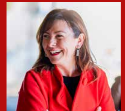
Carole DELGA Présidente de la Région Occitanie Pyrénées-Méditerranée Présidente de Régions de France

C'est collectivement, avec courage, lucidité, solidarité que nous construirons une croissance durable à partir d'un nouveau modèle plus souverain, plus résilient et plus respectueux de l'environnement. ”