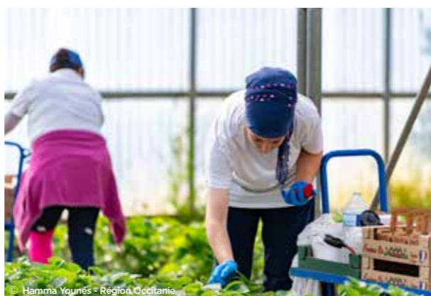
© Hamma Younés - Région Occitanie